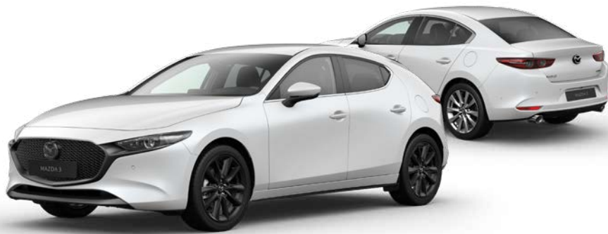
SNOWFLAKE WHITE PEARL