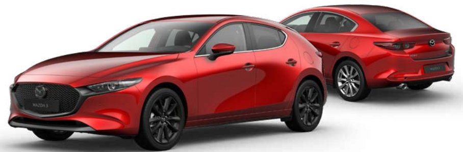
SOUL RED CRYSTAL METALLIC