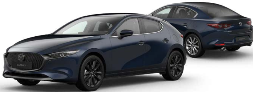
DEEP CRYSTAL BLUE MICA