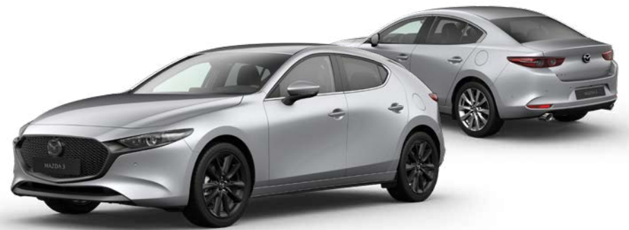
SONIC SILVER METALLIC