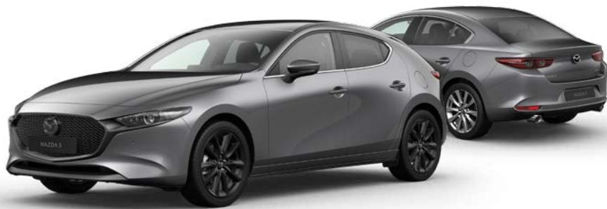
MACHINE GRAY METALLIC