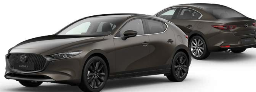
TITANIUM FLASH MICA