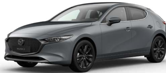
POLYMETAL GRAY METALLIC