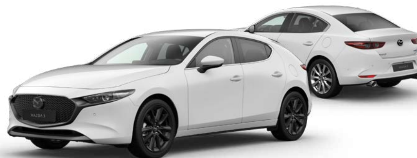
ARCTIC WHITE SOLID

U hebt keuze uit negen kleuren. De basiskleur is Arctic White Solid. De meest exclusieve kleuren zijn Machine Gray Metallic en Soul Red Crystal Metallic. Hierbij zorgt een speciale laktechniek met nog kleinere en helderder aluminium deeltjes voor een ongekend diepe, heldere kleur en een prachtige glans. Met deze intensieve kleuren blinkt uw Mazda3 als een spiegel en is hij nog meer een eyecatcher.